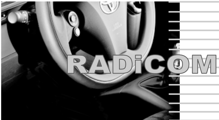
Interfaccia universale comandi al volante wireless